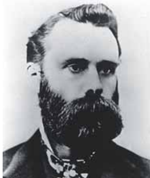
Чарльз Доу и Эдвард Джонс: «Манипулятор всемогущее какое-то время. Но манипуляция не может быть вечной. В конце концов инвестор узнает правду и реальную цену»

Работая биржевыми аналитиками, Доу и Джонс нередко становились свидетелями того, что цена акций изменяется под влиянием явно нерыночных факторов. Главная биржа Нового Света в конце XIX века находилась во власти слухов, продажных журналистов, инсайдеров (к ним вполне можно было отнести и босса наших героев – Киернана, ставшего сенатором, и с помощью своего агентства решавшего личные вопросы). Честных провинциалов такие правила игры не устраивали. Поэтому однажды Доу и Джонс решили открыть собственное финансовое издание. Его главными принципами стали достоверность информации и неучастие в рыночных манипуляциях. Причем сотрудни-